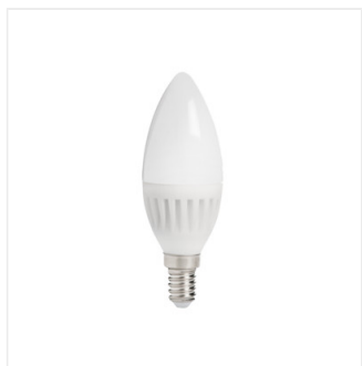
DUN HI 8W E14