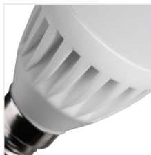
DUN HI 8W E14