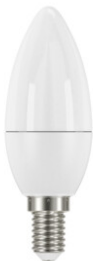
iQ-LED C37E14 5,5W