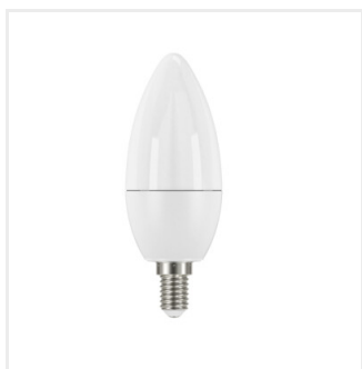
iQ-LED C37E14 7,5W