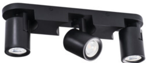
LAURIN EL-3I B