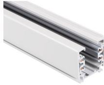
33232 TEAR N TR 2M-W

Sínes rendszer elem, TEAR N TR 2M-W, 3 fázisú sín, fehér (33232)