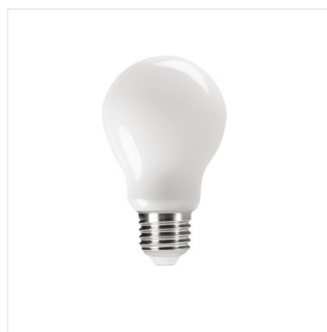
XLED A60 4,5W; 7W; 8W; 10W NW; WW; CW - M