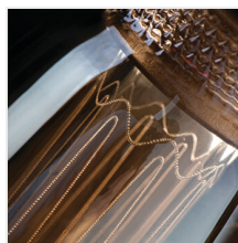
ST64 A 4W-SW