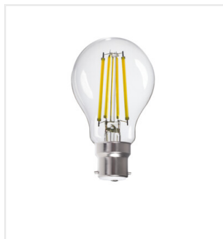
XLEDIM A60 B22 12W-CW