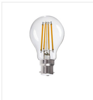
XLEDIM A60 B22 12W-WW