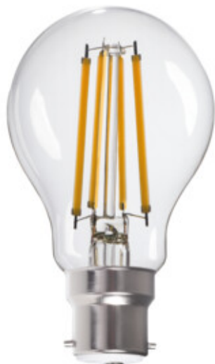
XLEDIM A60 B22 12W-WW