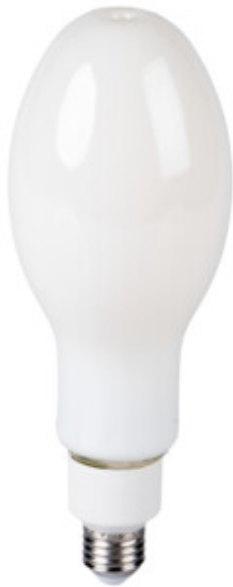
XLED HP D90E27 26W-NW