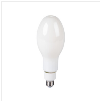
XLED HP D90E27 26W-NW