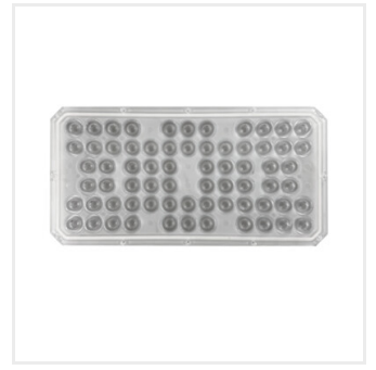
FLS LENS 40D