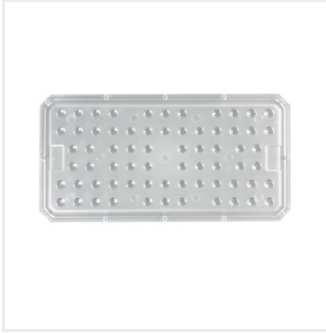
FLS LENS 90D