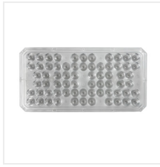
FLS LENS 20D