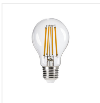
XLEDIM A60 E27 11W-WW