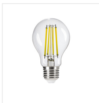
XLEDIM A60 E27 11W-CW