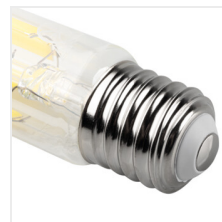
XLED HP EX E40 43W-NW