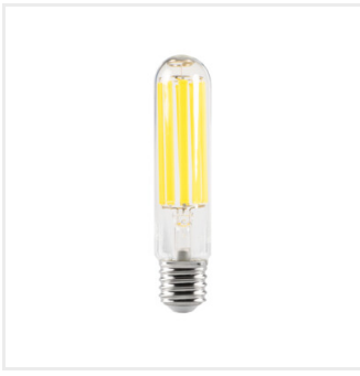
XLED HP EX E40 43W-NW