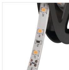
LEDS-B 4.8W/M IP00