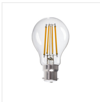
XLEDIM A60 B22 12W-WW