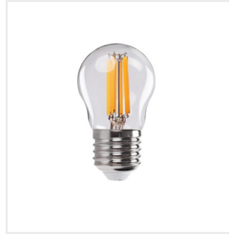
XLEDEX G45E27 3,8W-WW