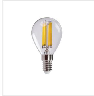
XLEDEX G45E14 3,8W-NW