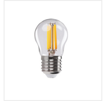
XLEDEX G45E27 3,8W-NW