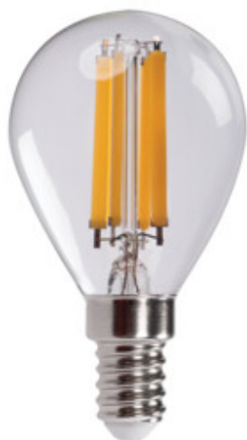
XLEDEX G45E14 3,8W-WW