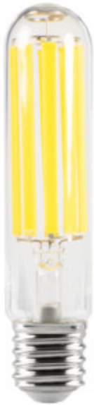
XLED HP EX E40 43W-NW