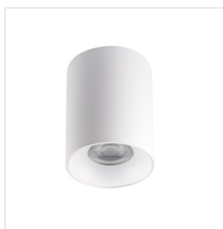
RITI GU10 W/W