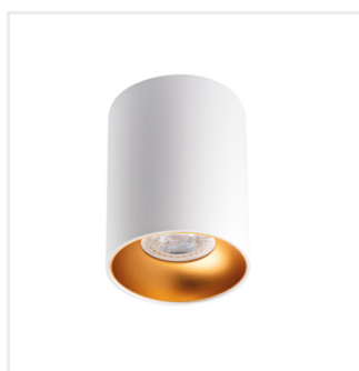
RITI GU10 W/G