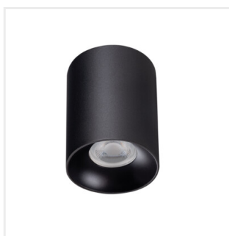
RITI GU10 B/B