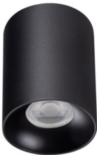
RITI GU10 B/B