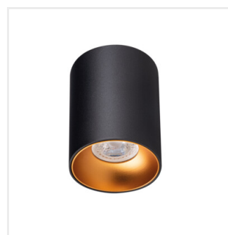
RITI GU10 B/G