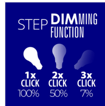
XLED A60 7W-STEPPDIM