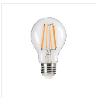
XLED A60 7W-STEPPDIM