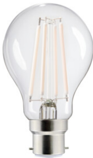
XLEDIMW A60 B22 7W-WW