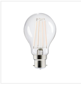
XLEDIMW A60 B22 7W- WW