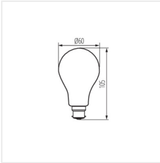
XLEDIMW A60 B22 7W- WW