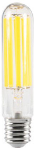
XLED HP EX E40 43W-NW