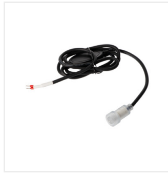
GIVRO-PR SET W/O PLUG