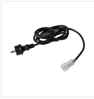
GIVRO - PR SET