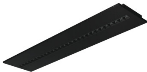
OSD TW RST B P3

Zakres temperatury otoczenia, na którą może być narażony wyrób [°C]: 5÷25