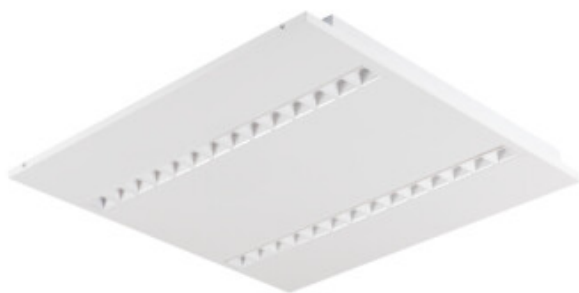
OSD TW RST W P1