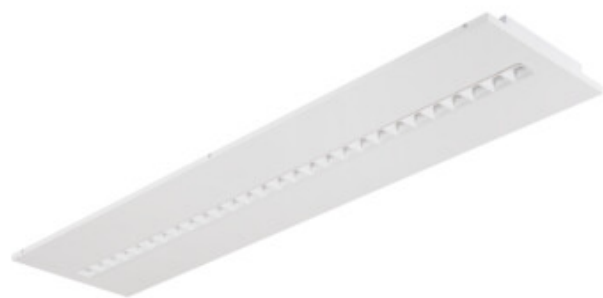
OSD TW RST W P3

Zakres temperatury otoczenia, na którą może być narażony wyrób [°C]: 5÷25