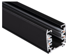
33232 TEAR N TR 2M-W

Élément de système de rails, TEAR N TR 2M-W, barre collectrice 3-circuit, blanc, (33232)