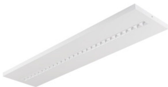
OSD TW RST W N3

Zakres temperatury otoczenia, na którą może być narażony wyrób [°C]: 5÷25