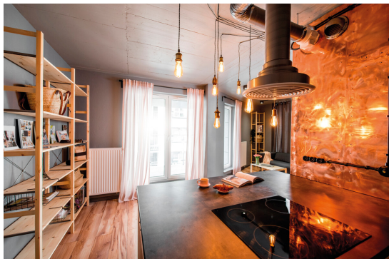
KANLUX S.A. (kat 26047) ST64 A 4W-SW / LDC (Polar)

Luminaire: KANLUX S.A. (kat 26047) ST64 A 4W-SW Lamps: 1 x ST64 A 4W-SW