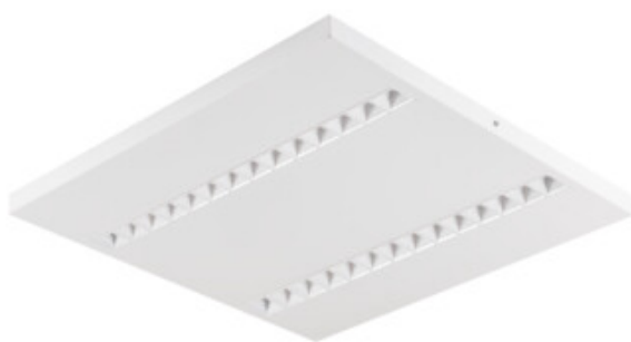
OSD TW RST W N1