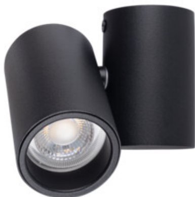
BLURRO GU10 CO-B