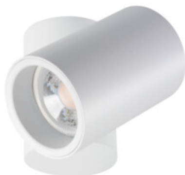
BLURRO GU10 CO-W