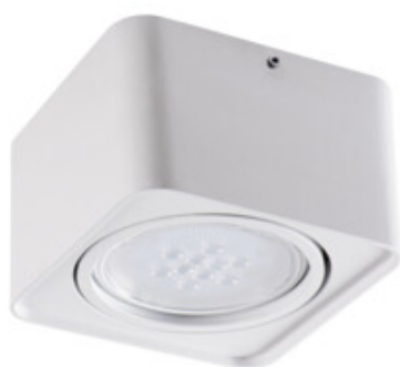
TUBEO ES 50-W