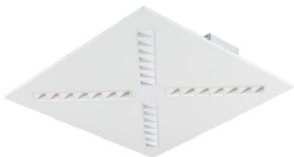
OS RX W P1