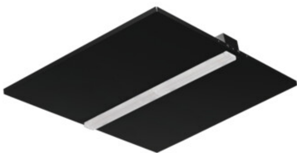
KND B P1