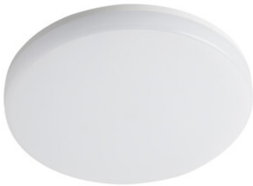
VARSO LED 24W-O; VARSO LED 24W-O-SE