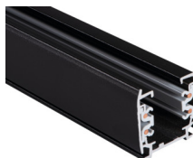
33233 TEAR N TR 2M-B

Komponent lištového systému, TEAR N TR 2M-B, 3-fázová lišta, černá, (33233)