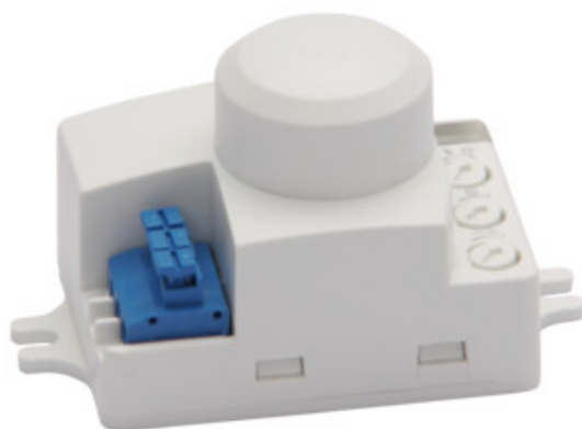
ROLF MINI JQ-L